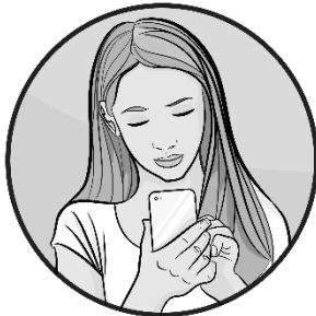
Chef de projet