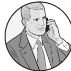
Directeur général des services